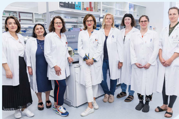
Team der Spezialambulanz